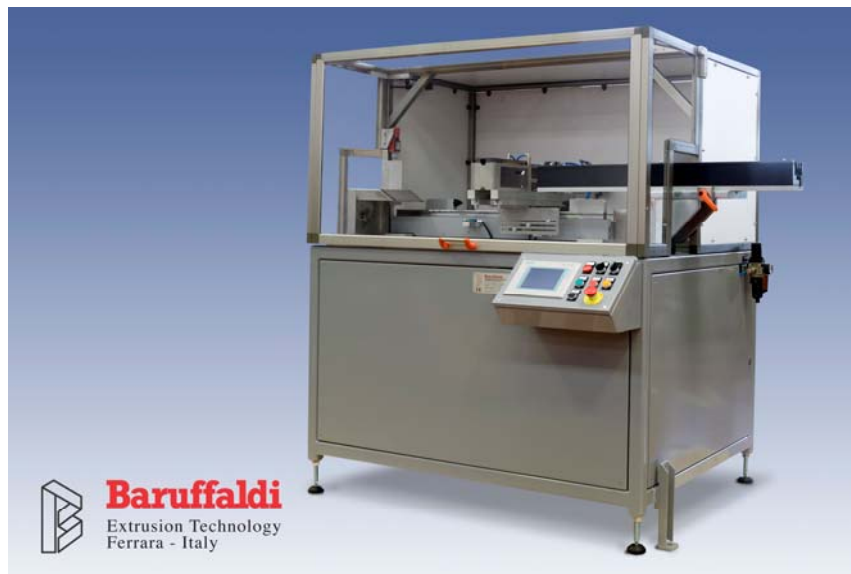
(Esempio di ghigliottina in linea di estrusione)